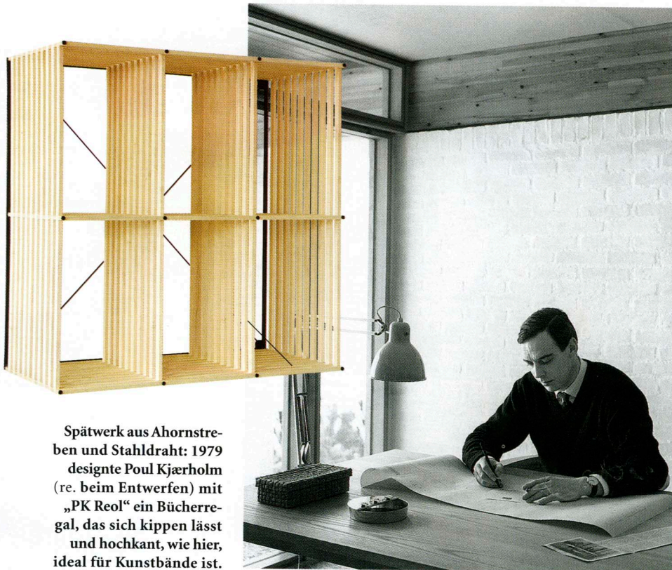
Spätwerk aus Ahornstreben und Stahldraht: 1979 designte Poul Kjærholm (re. beim Entwerfen) mit „PK Reol“ ein Bücherregal, das sich kippen lässt und hochkant, wie hier, ideal für Kunstbände ist.